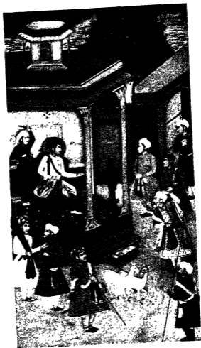
सम्राट जहाँगीर से सर शमसरो की भेंट

Part of the contents of the Emperor Victoria Memorial, 1904-1911